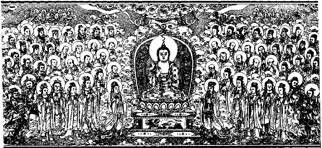
清刻龍藏佛說法變相圖