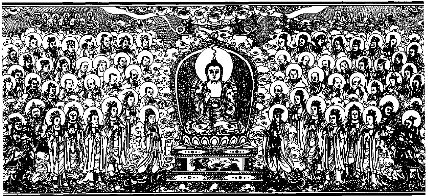
清刻龍藏佛說法變相圖